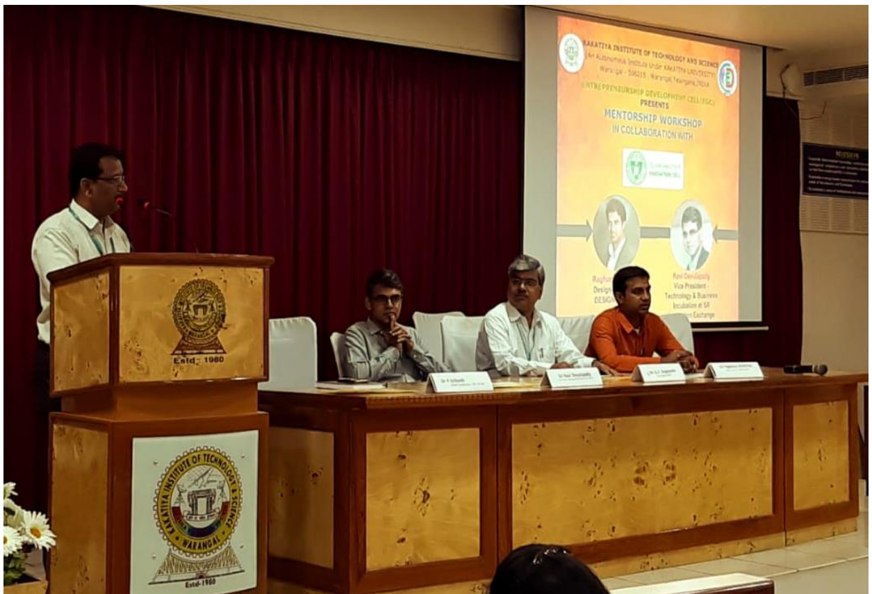
Inaugural session of Mentorship Workshop (31.01.2019)