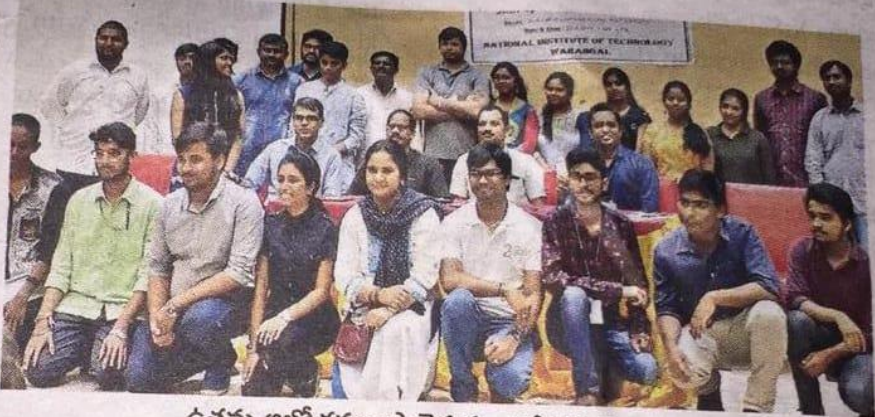
ఉత్తమ ఆలోచనల ప్రాజెక్టుకు ఎంపికైన విద్యార్థులు

నిట్ క్యాంపస్, న్యూన్ టుడే: కేంద్ర, రాష్ట్ర ప్రభుత్వాలు సంయుక్తంగా నిర్వహిస్తున్న స్టార్ట్ అప్ ఇండియా తెలంగాణ యాత్రలో భాగంగా జాతీయ సాంకేతిక సంస్థ (ఎన్ ఐటీ)లో శనివారం ఐడి యేషన్ బూట్ క్యాంపులో విద్యార్థులు సమర్పించిన ఉత్తమ ఆలోచనలను రాష్ట్ర స్థాయికి ఎంపిక చేశారు. ఈ క్యాంపెయిన్ ను తెలంగాణలో ఐటీ శాఖా మంత్రి సెప్టెంబరు 15న ప్రారంభించి అక్టోబరు 5 వరకు రాష్ట్రవ్యాప్తంగా 12 కేంద్రాలలో నిర్వహించి ఆసక్తి కలిగిన వారి నుంచి ఆలోచనలు స్వీకరిస్తున్నారు. నిట్ లోని బీఆర్.అంబేద్కర్ అధ్యయన కేంద్రంలో జరిగిన సమావేశంలో 46 మంది విద్యార్థులు తమ ఆలోచనలు సమర్పించారు. వీటిలో 13 ఆలోచనలను అక్టోబరు 3