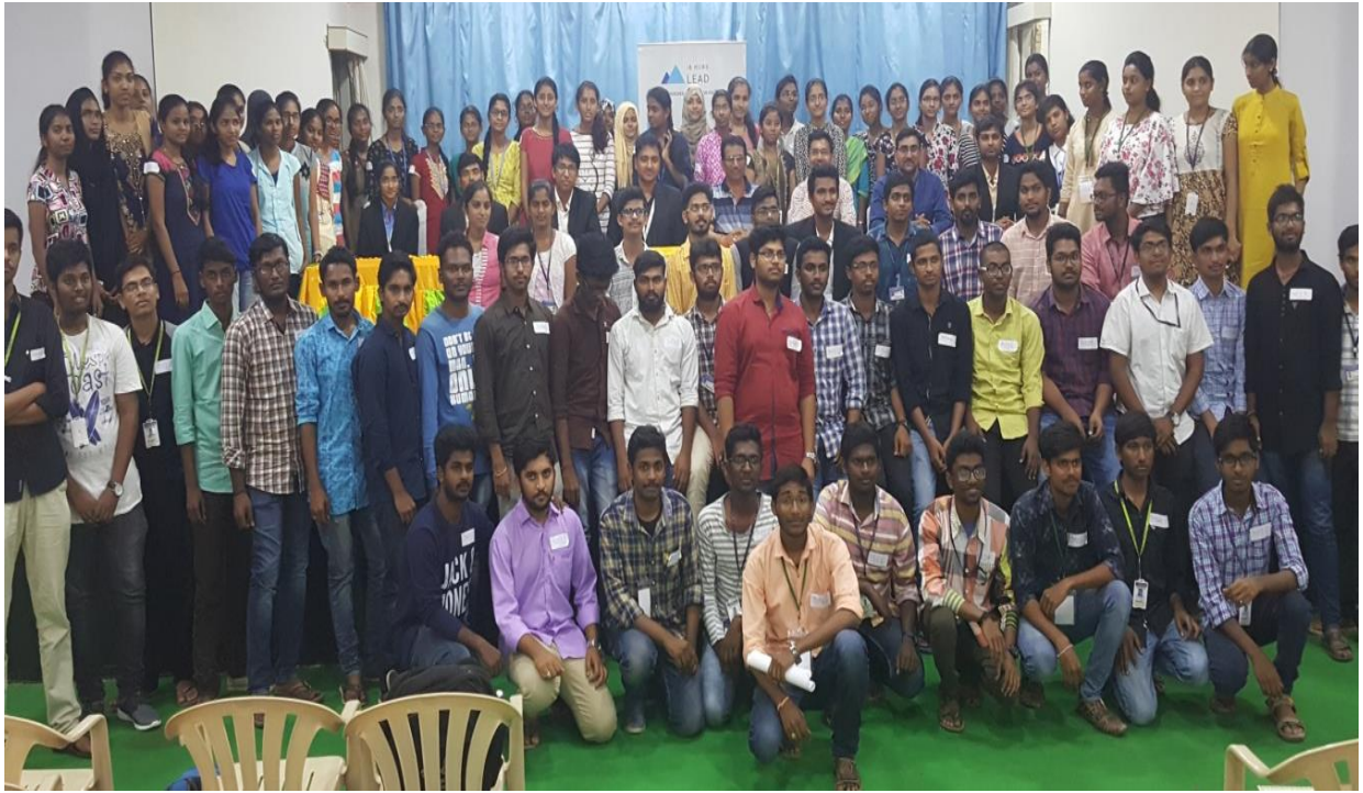
Inaugural function of ISB-TEP orientation programme (04.09.2018)