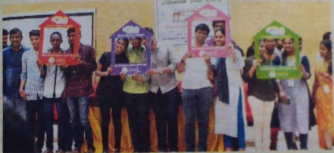
ఐడియాస్ బూట్ క్యాంప్ లో పాల్గొన్న స్టూడెంట్స్